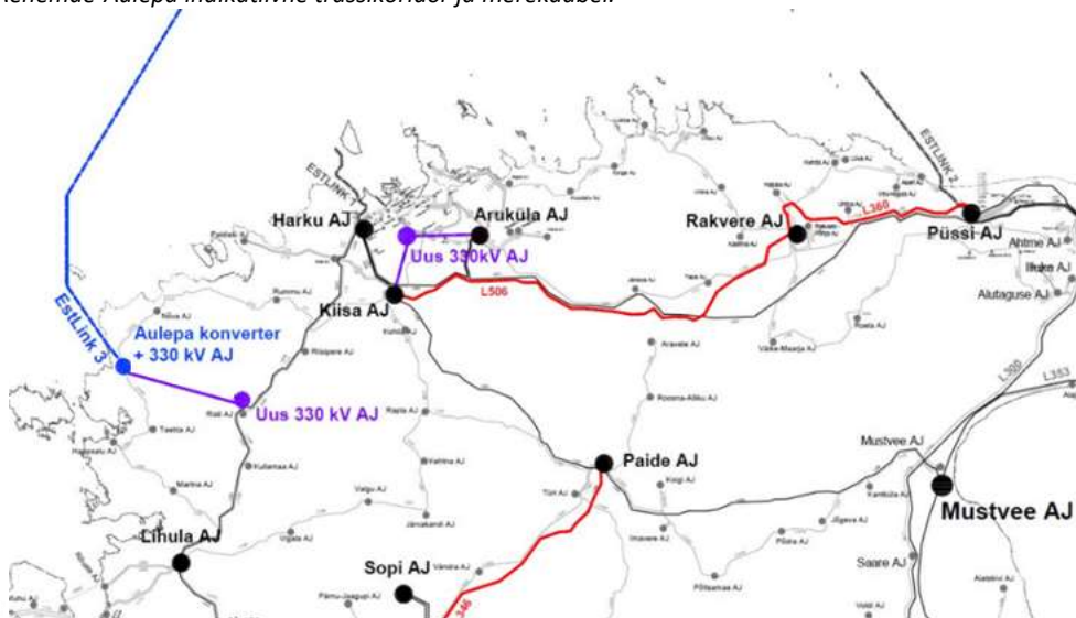
Joonis 2. Seoses EstLink 3 rajamisega võrgu üldine plaan.